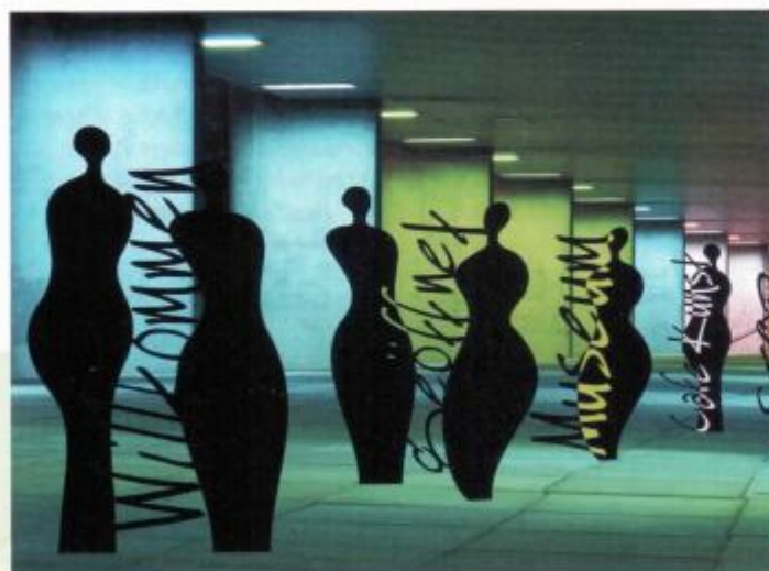
Produktsegment „Artifex“ – Silhouetten für öffentliche und private Anlagen.