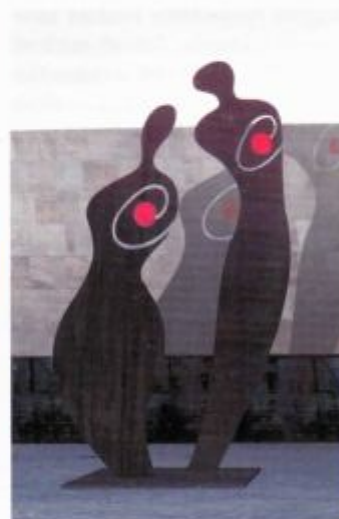
Variante mit eingesetztem rotem Glas „herz“.