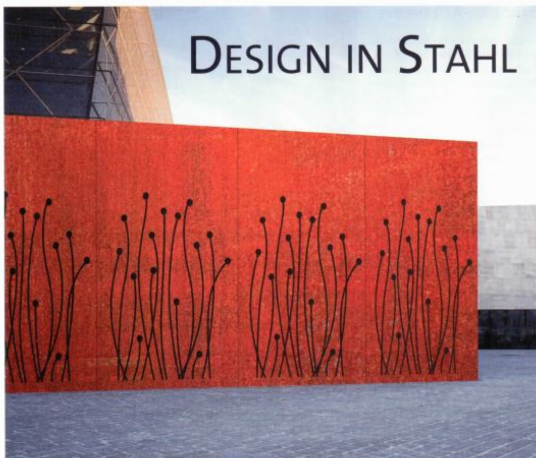
Sichtschutzwand aus Corten-Stahl mit gelasertem Ornament.

Metall in neue Formen bringt das Unternehmen Mecondo aus Rietberg. Mecondo wendet sich mit seinen Produkten an Profikunden, speziell an den Garten- und Landschaftsbau sowie an Landschaftsarchitekten.